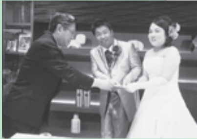
玉井町長からお祝いを 受けられるお二人