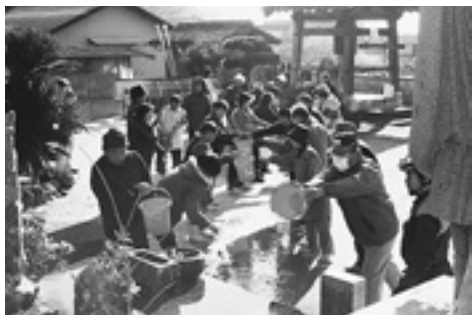
みんなで力を合わせたバケツリレー

文化財防火デーにちなみ、一月二十四日、川端の妙薬寺で、文化財防火訓練があり、約七十名が参加しました。発煙機着火、「火事だ!」、一一九番通報、バケツリレーによる初期消火、宝物搬出、消防隊による放水、そして鎮火と、見事なチームプレーでした。その後、消防署員から、火器の使い方の説明があり、地元の皆さん十数人の、テキパキとした消火実習が繰り広げられました。