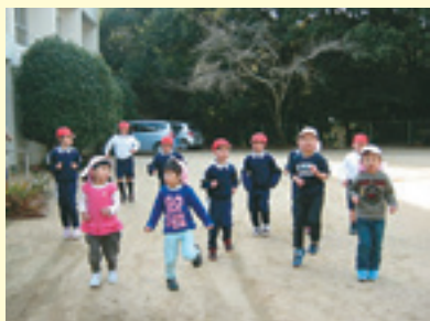
マラソンの練習がんばるぞ！

「あと一周で、十周だ。せこいけど、がんばるぞ。」 十一月の半ばから、おはようさわやかマラソンが始まりました。五分間曲に合わせ、自分のペースで運動場を走っています。分園の四人も、分校のお兄さんやお姉さんに負けまいと息をはずませて一生懸命です。 十二月十七日には、本校でマラソン記録会がありました。ほとんどの子どもたちが、十一月の記録よりもよくなって、毎日の努力の成果が表れたと、喜んでいきます。休み時間には、三学期の縄