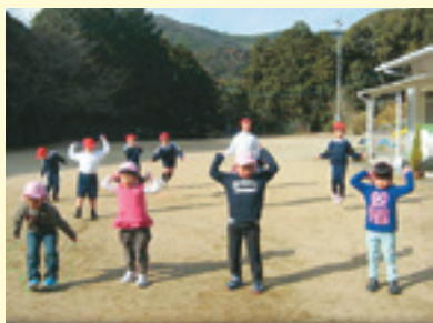
縄跳び、どれだけ跳べるかな？

「あと一周で、十周だ。せこいけど、がんばるぞ。」 十一月の半ばから、おはようさわやかマラソンが始まりました。五分間曲に合わせ、自分のペースで運動場を走っています。分園の四人も、分校のお兄さんやお姉さんに負けまいと息をはずませて一生懸命です。 十二月十七日には、本校でマラソン記録会がありました。ほとんどの子どもたちが、十一月の記録よりもよくなって、毎日の努力の成果が表れたと、喜んでいきます。休み時間には、三学期の縄