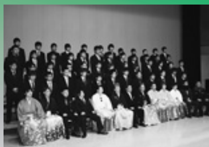
▲みんなで並んで記念写真

これからの人生、新成人の皆さんには、失敗を恐れることなく、自分の意志をもって歩んでほしいと思います。