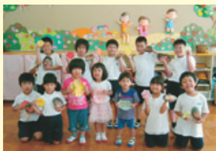
プレゼント完成！早く渡したいな！

九月二十一日の敬老の日に、子どもたちは、いつもお世話になっておられるおじいちゃん、おばあちゃんに、感謝の気持ちを込めて、プレゼントを贈りました。丸い石に、おじいちゃん、おばあちゃんの顔の絵を描き、カードにメッセージを書きました。「いつもありがとう。やさしいから大好き。ずっとずっと長生きしてね。」「送りむかえやお世話をしてくれてありがとう。」「お料理おいしいよ。」「遊んでくれてありがとう。」「このプレゼント作りをす