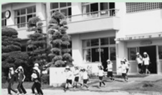
▲ヘルメットをかぶって避難