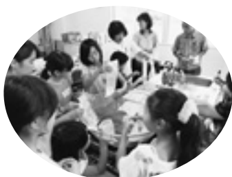
自分の食べるものは自分で…炊き出し訓練も体験しました。