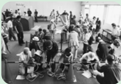
▲ロープワークの体験