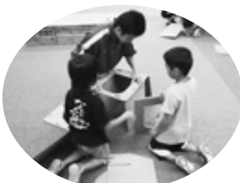
板野高校防災クラブのお兄ちゃんと一緒に簡易トイレの組み立て。4チームに分かれてヨーイドン！