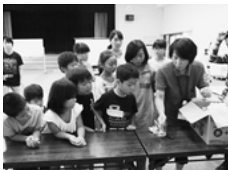
夜の防災探検で使う灯りづくり。小学生にはちょっと難しかったかな？