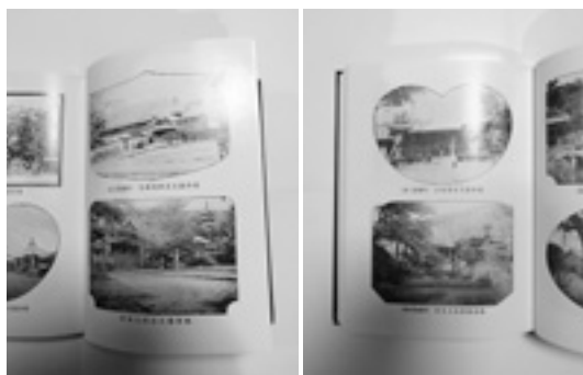
『阿波名勝案内』の板野

もうすでに消滅したり、破損したりしたものもあるが、かつてのわが町板野の歴史的な姿を今に伝え残している。できうれば又機会を見、紹介を続けたい。