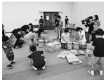
段ボールを組み合わせて簡易ベッドを作りました。思ったよりも丈夫で、荷物を段ボールの中に入れることでスペースを省くことができます。