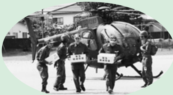
▲救援物資輸送訓練

また、緊急物資の輸送を想定した陸上自衛隊のヘリコプター離発着訓練も行われました。