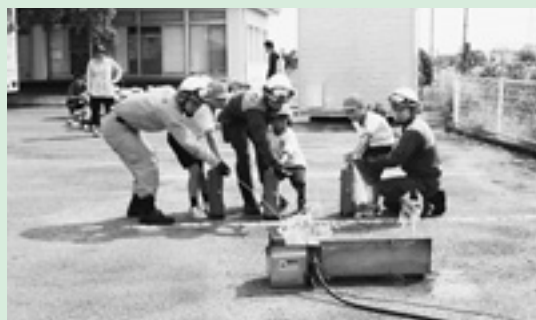
▲消防士と一緒に消火訓練