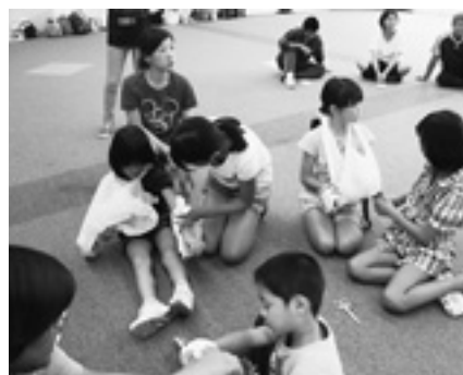
身の周りにあるスーパーの袋、ラップを使って応急処置体験。