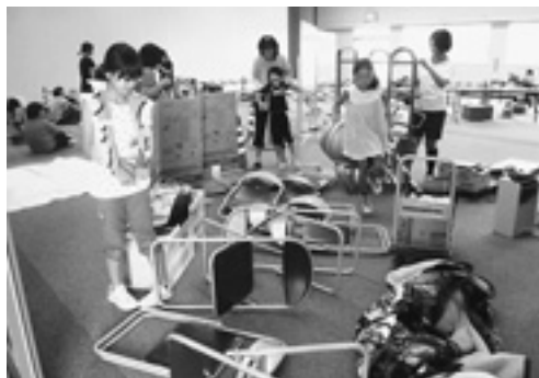
発災時の避難経路を想定しての避難シミュレーション。チームで協力して助け合い。何を最優先に考える？自分？ケガをした人？