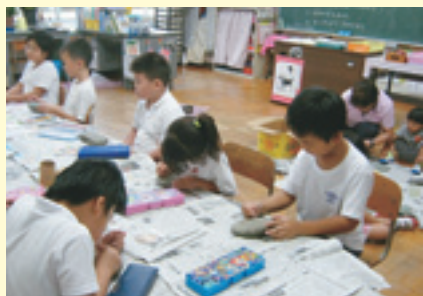
おじいちゃん、おばあちゃん、喜んでくれるかな。

九月二十一日の敬老の日に、子どもたちは、いつもお世話になっておられるおじいちゃん、おばあちゃんに、感謝の気持ちを込めて、プレゼントを贈りました。丸い石に、おじいちゃん、おばあちゃんの顔の絵を描き、カードにメッセージを書きました。「いつもありがとう。やさしいから大好き。ずっとずっと長生きしてね。」「送りむかえやお世話をしてくれてありがとう。」「お料理おいしいよ。」「遊んでくれてありがとう。」「このプレゼント作りをす