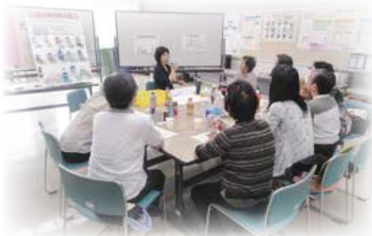
保健師・栄養士と学ぼう

ライフスタイルの変化にともない、生活習慣病は年々増加傾向にあり、自主的な健康づくりがいつそう大切になっていきます。住民が健康に関心を持ち、いきいきと健やかに暮らせるように、これまでの取り組みをさらに進め、様々な機会を通じて健康づくりへの取り組みを応援します。