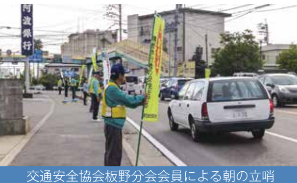
交通安全協会板野分会会員による朝の立哨