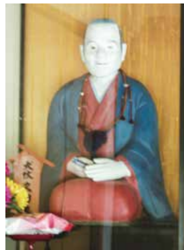
犬伏久助座像（藍染庵）