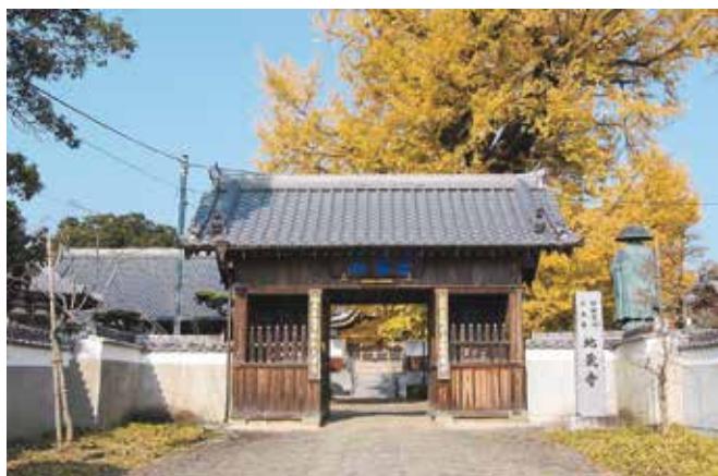
四国霊場第五番札所 地藏寺