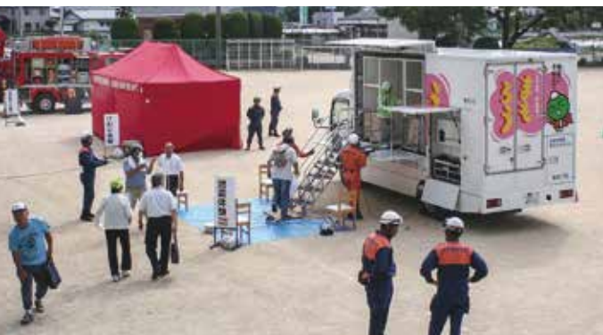
板野町防災訓練（平成 26 年度南地区）

また、現在、震災やその他災害に関して、予防・対策・復旧等についてとりまとめた板野町地域防災計画の見直しも進めています。