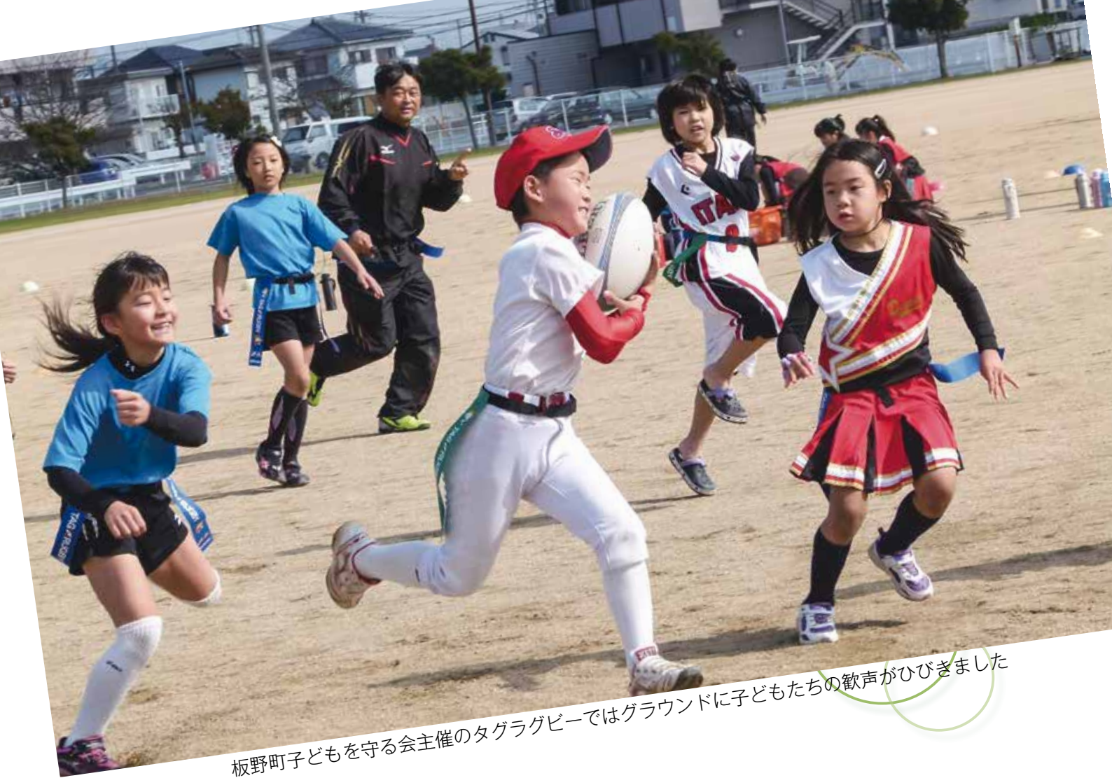
板野町子どもを守る会主催のタグラグビーではグラウンドに子どもたちの歓声がひびきました