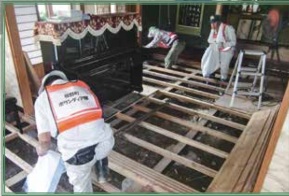
被災地へボランティアを派遣