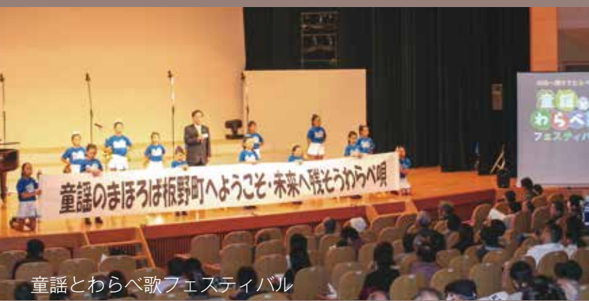
童謡とわらべ唄フェスティバル