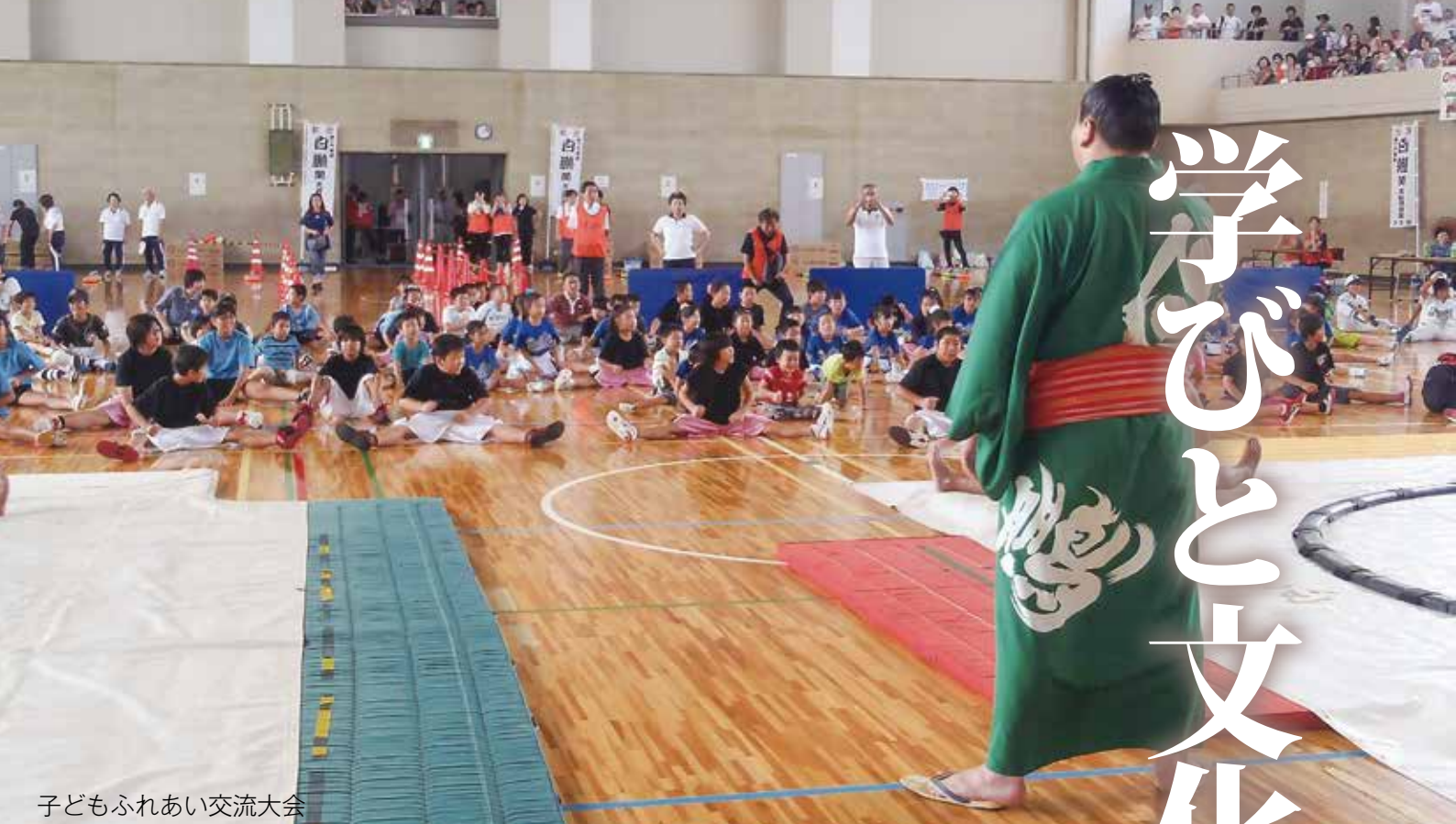
子どもふれあい交流大会