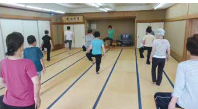
元気でいこよ運動教室