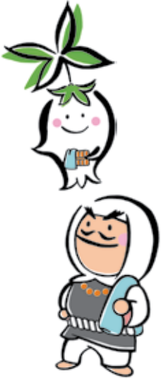
あせびちゃんと弁慶くん