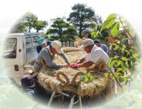
大わらじ新調作業