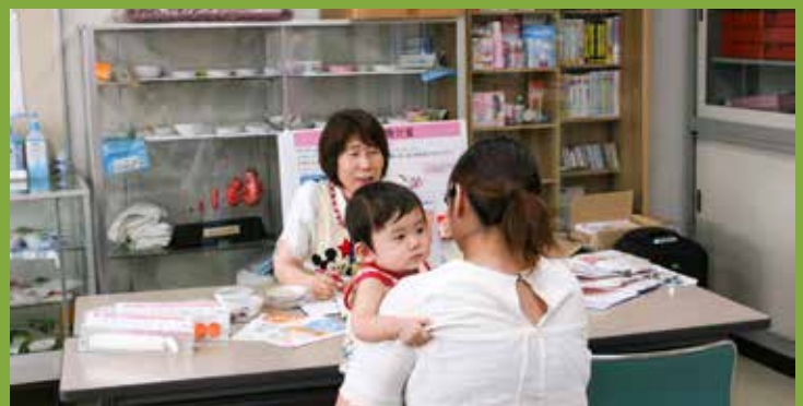
管理栄養士による栄養相談