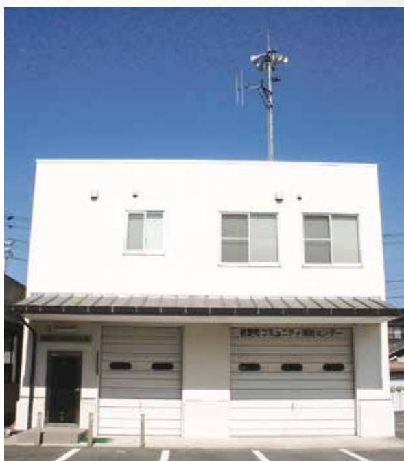
コミュニティ消防センター

いつ起こるかかわからない様々な自然災害に対し、「自助・共助・公助」による、自分の身は自分で守るという自主防災意識の高揚と、住民相互の協力体制など災害時に効率かつ迅速的な対応ができる体制づくりをめざします。