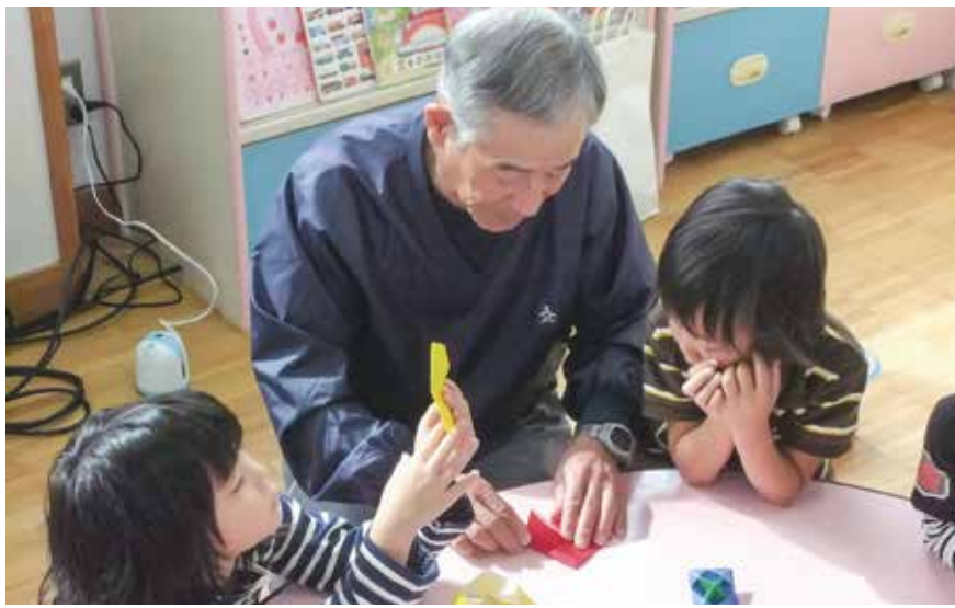
老人クラブ会員による児童館での折り紙教室