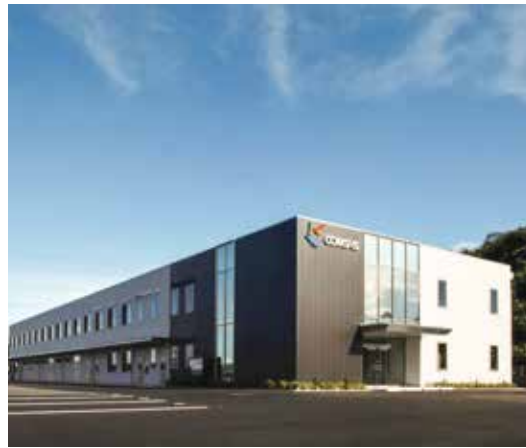
■ 日本コムシス(株) 徳島営業所