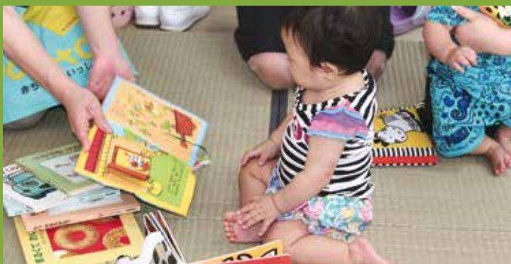
ブックスタート事業