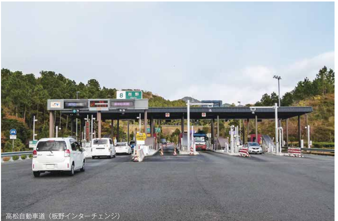
高松自動車道 (板野インターチェンジ)