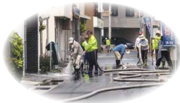
町民による排水路清掃