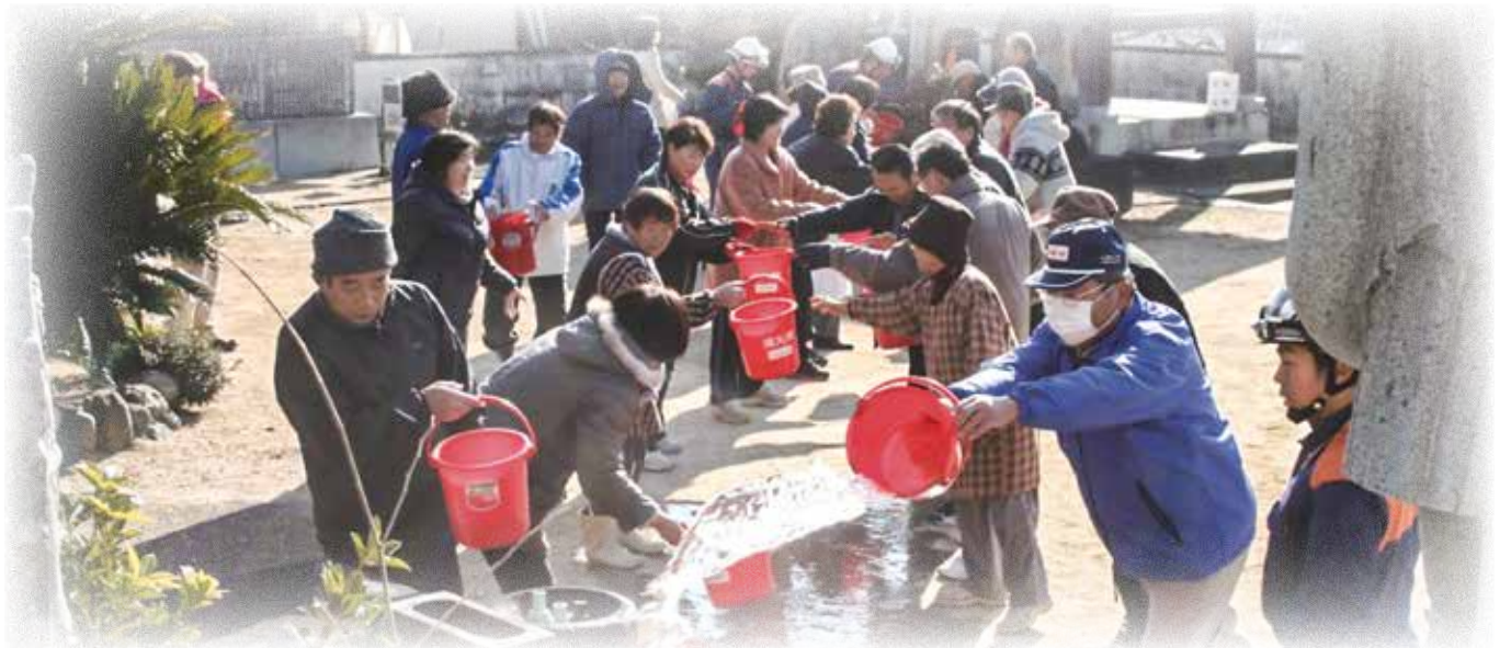
町内の寺社での文化財防火訓練