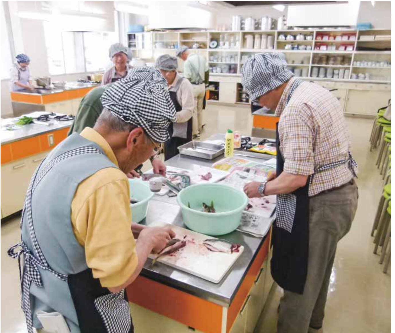
男性チャレンジ教室では料理や運動に取り組んでいます