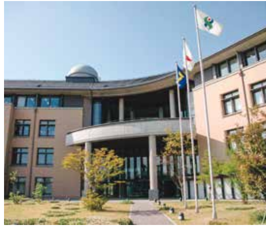
■ 徳島県立 総合教育センター