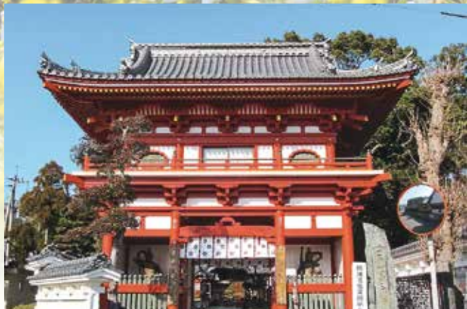
四国霊場第三番札所 金泉寺

文化財は、私たちの祖先の生活のあかしです。その一つひとつが歴史であり、遺産であり町の貴重な財産です。町の貴重な財産を次世代に受け継ぐため、文化財や伝統芸能、文化意識を高め継承していきます。