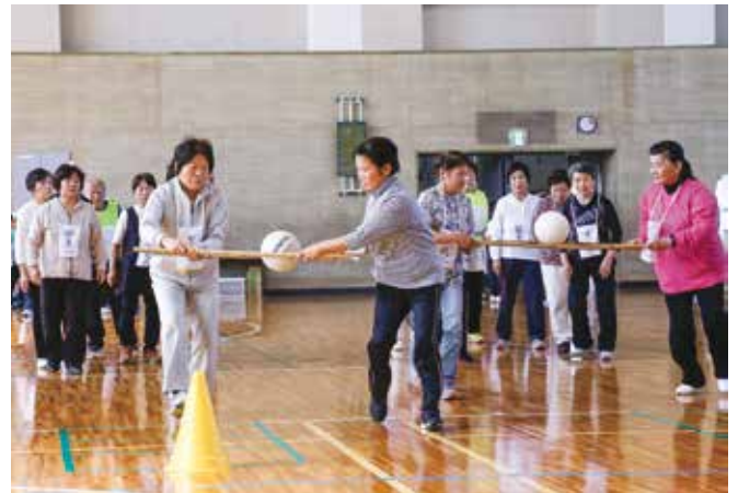
老人クラブ連合会体育大会