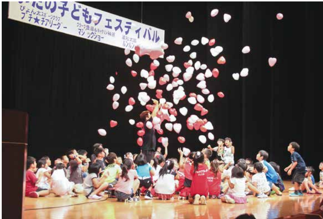
いたの子どもフェスティバル

子どもたちが明るくのびのびと成長できるように、少子化対策や子育て支援対策を重要施策ととらえ、義務教育終了までの乳児医療の無料化、幼稚園から中学校までの給食費の半額補助など、子育て家庭の経済的支援の充実を図ります。 また、地域や関係機関との連携を深めながら、地域子育て支援センター等の機能充実を図り、安心して子どもを産み育てることのできるまちづくりをめざします。