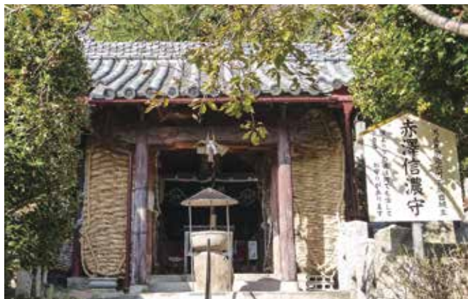
愛染院（赤澤信濃守廟所）