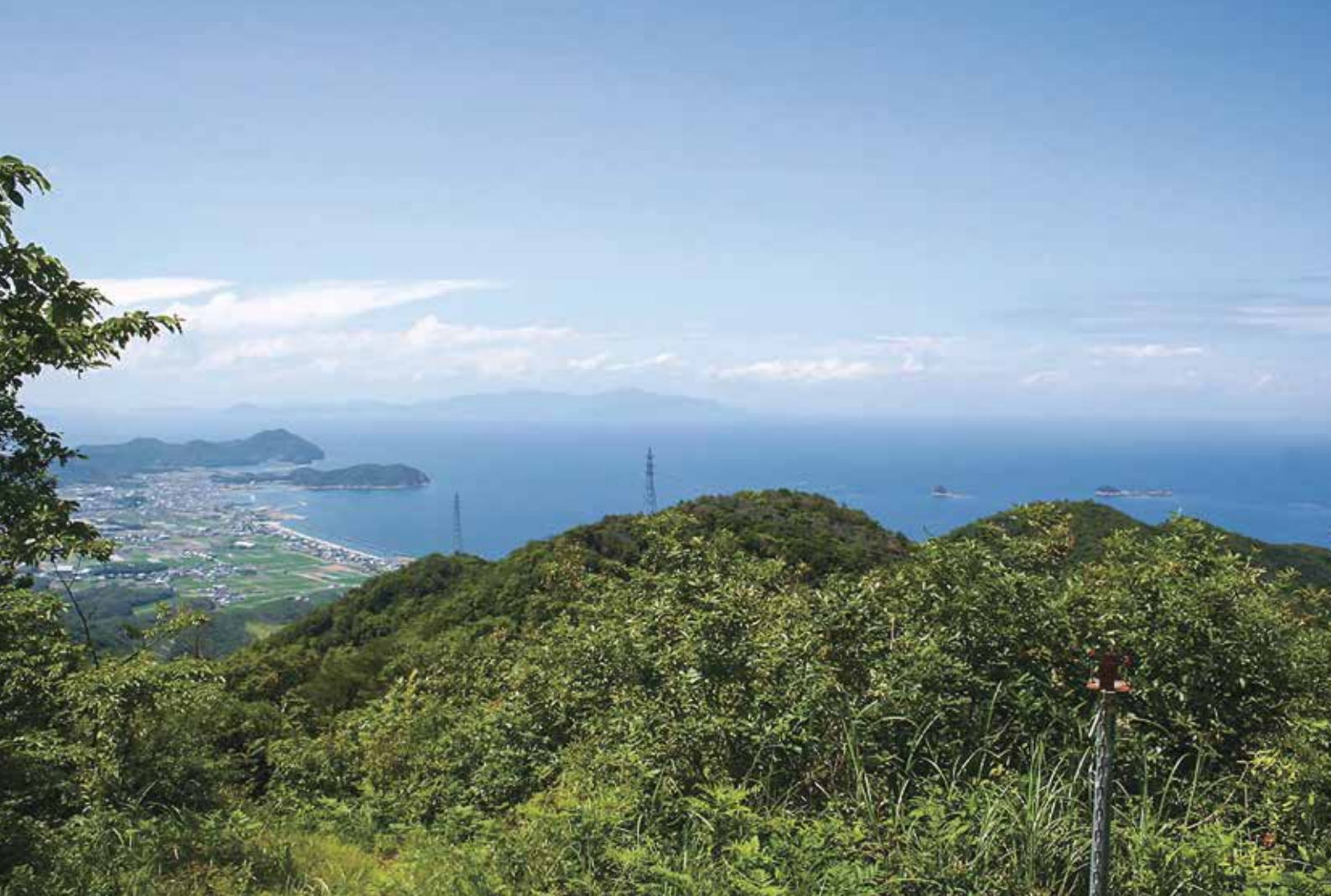
大坂峠展望台から見た風景