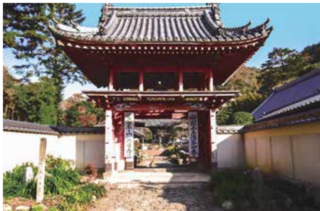
四国霊場第四番札所 大日寺