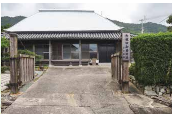
大坂口御番所跡 旧村瀬館