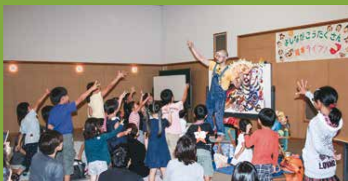
絵本作家による絵本ライブ