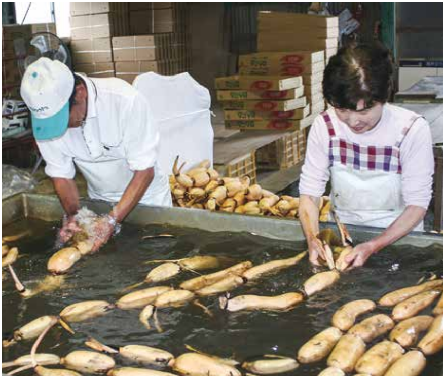
収穫したれんこん出荷前の洗浄作業