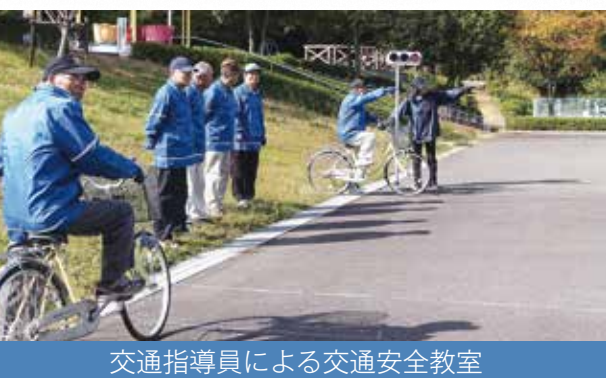
交通指導員による交通安全教室