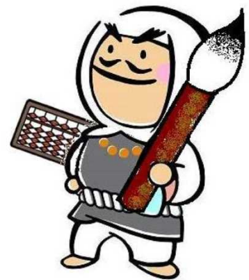
【板野町あせび温泉やすらぎの郷 マスコットキャラクター：弁慶くん】