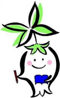
【板野町あせび温泉やすらぎの郷 マスコットキャラクター：あせびちゃん】