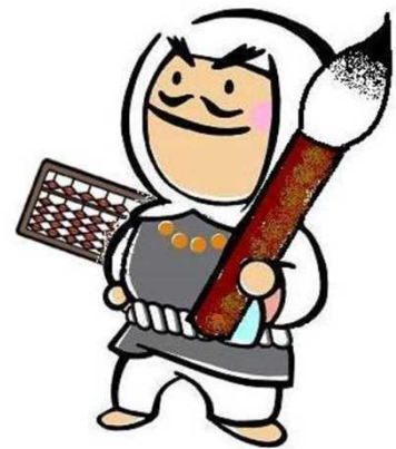
【板野町あせび温泉やすらぎの郷 マスコットキャラクター：弁慶くん】