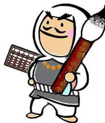
【板野町あせび温泉やすらぎの郷 マスコットキャラクター：弁慶くん】