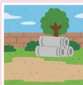
倒壊の危険がある建物等から広い場所へ避難