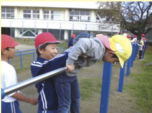
まえまわりができたよ～お兄さんありがとう♡

本園では、二学期より月二回小学校のみなみWAタイムに参加させてもらっています。五・六年生を対象に年長・年少児全員で交流をしています。幼児教育から小学校教育に円滑に移行でき、入学後スムーズに学校生活に馴染めるようにと願い取り組んでいます。 最初の頃は、手を繋ぐことも緊張していましたが、今では、みなみWAタイムの日の楽しみにし、鉄棒を一緒にしたり転がしドッジやしっぽとりゲームを楽しめるようになってきました。