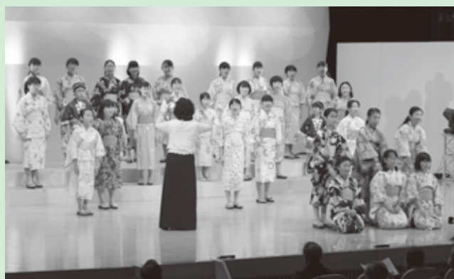
徳島少年少女合唱団の皆さん