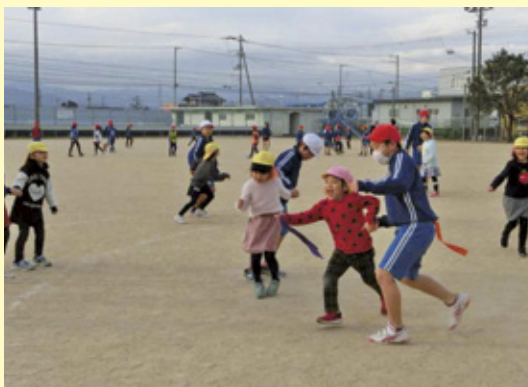
しっぽをGetするぞー！

本園では、二学期より月二回小学校のみなみWAタイムに参加させてもらっています。五・六年生を対象に年長・年少児全員で交流をしています。幼児教育から小学校教育に円滑に移行でき、入学後スムーズに学校生活に馴染めるようにと願い取り組んでいます。 最初の頃は、手を繋ぐことも緊張していましたが、今では、みなみWAタイムの日の楽しみにし、鉄棒を一緒にしたり転がしドッジやしっぽとりゲームを楽しめるようになってきました。