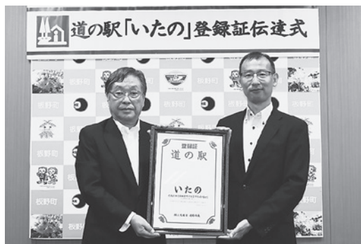
(左)玉井町長 (右)国土交通省徳島河川国道事務所・新宅所長

今回の登録により四国地方の道の駅としては88駅目(全国で1180駅)となりました。