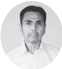
高富 成人 大寺