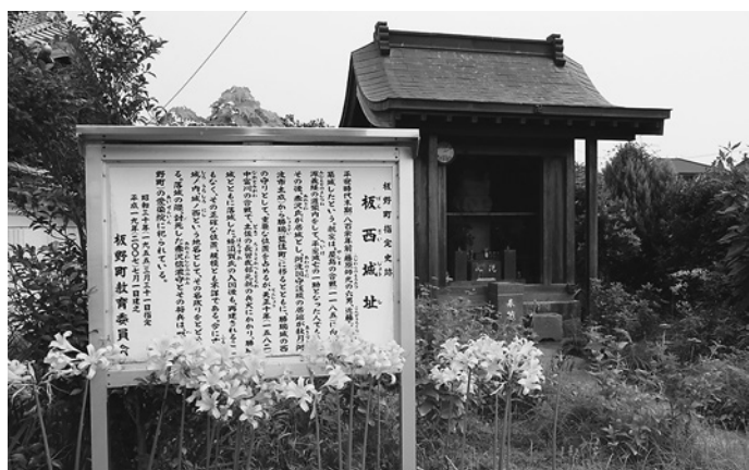
古城にある板西城址

阿波の国にかかわる歴史史料を蒐集し、編纂し出版した『阿波国徴古雜抄』（日本歴史地理學會大正二年刊）という貴重な歴史書がのこされている。阿波の生んだ幕末の国学者小杉樞郎が、その生涯をかけて、日本全国から集めた史料集だ。古代から中世へかけての史料が多い。