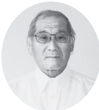
高原 洋市 那東