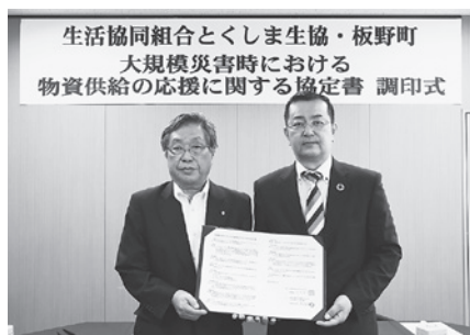
(左)玉井町長 (右)生活協同組合とくしま生協・大久保代表理事 理事長