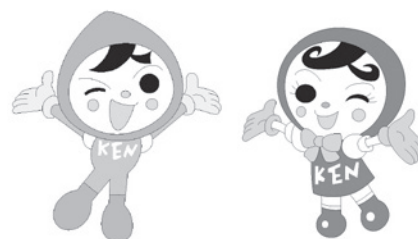
人権イメージキャラクター 人KENまもる君 人KENあゆみちゃん

今一度、新型コロナウイルス感染症に関する正しい情報をご確認いただき、人権侵害につながることをないように、冷静な行動をお願いします。