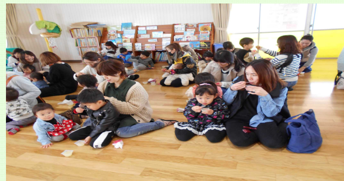
その後、すだちゼリーを食べました。（72名）参加