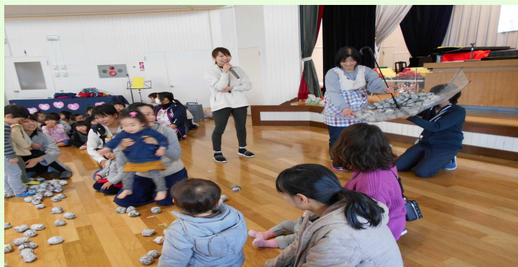
保育園の行事（お別れ会）に参加し親子で玉入れをしました。（3月）