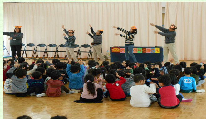
その後でホットケーキを食べました。