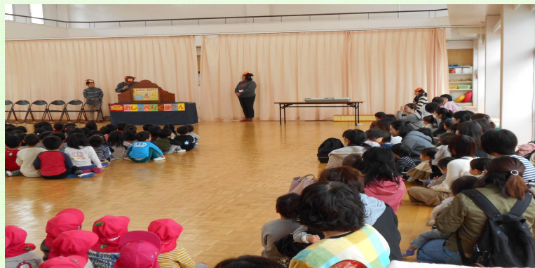
保育園のお友達と「おしゃべりくまさん」の公演を見ました（10月）