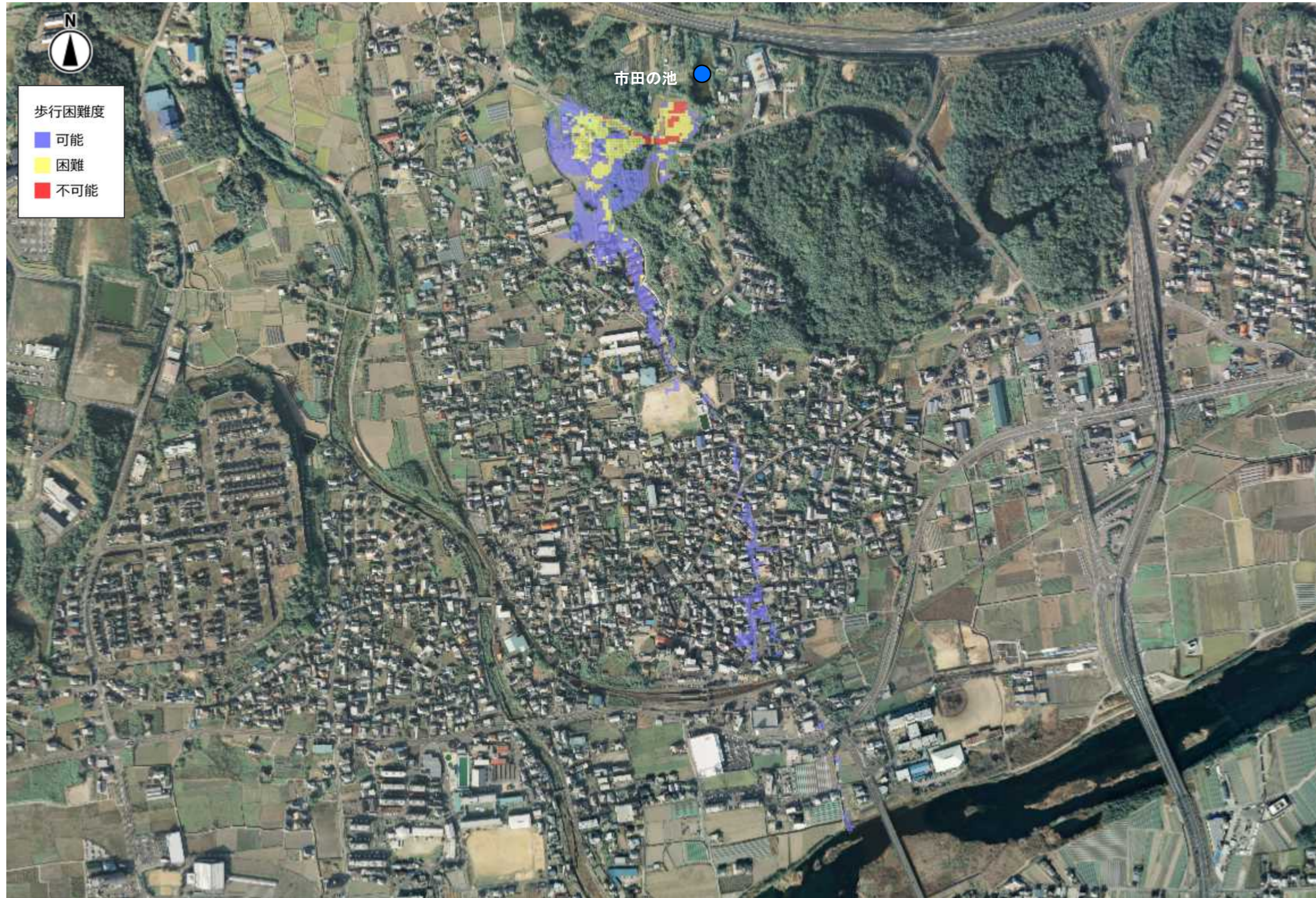
最大歩行困難度(市田の池)