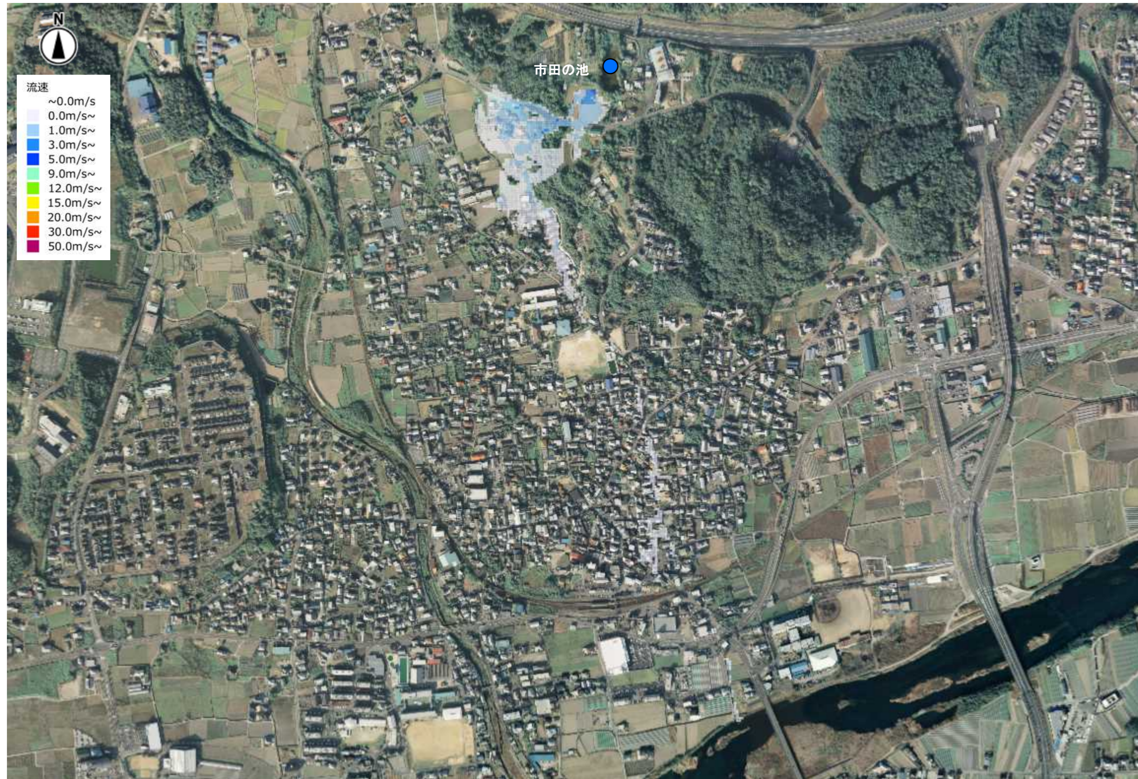
最大流速(市田の池)