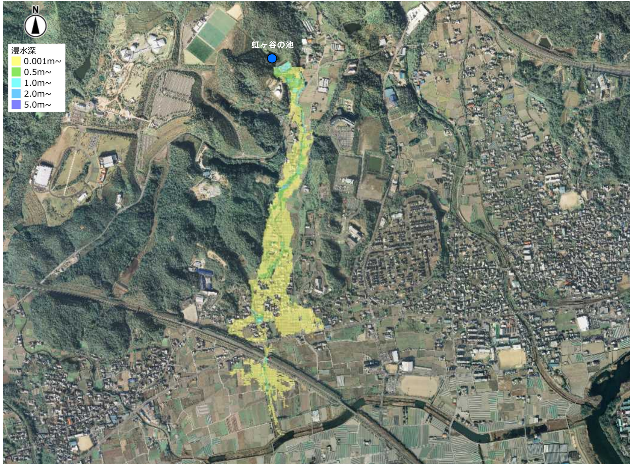
最大浸水深(虹ヶ谷の池)