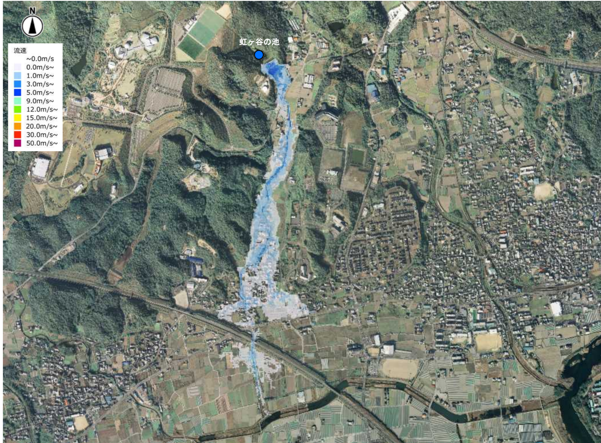
最大流速(虹ヶ谷の池)