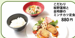
こだわり板野鶏根と金時豚のミンチカツ定食 880円