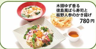
木頭ゆず香る徳島風ばら寿司と板野人参のかき揚げ 780円