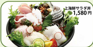
上海鮮サラダ丼 1,580円