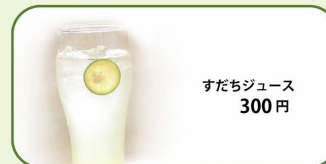
すだちジュース 300円