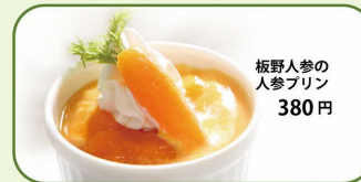
板野人参の 人参プリン 380円