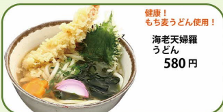
健康! もち麦うどん使用! 海老天婦羅 うどん 580円