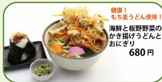
健康! もち麦うどん使用! 海鮮と板野野菜の かき揚げうどんと おにぎり 680円