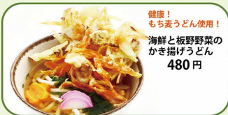
健康! もち麦うどん使用! 海鮮と板野野菜の かき揚げうどん 480円