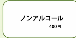
ノンアルコール 400円