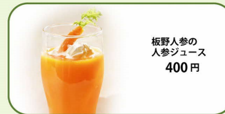
板野人参の 人参ジュース 400円