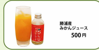
勝浦産 みかんジュース 500円