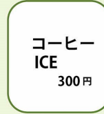
コーヒー ICE 300円