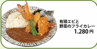
有頭エビと 野菜のフライカレー 1,280円