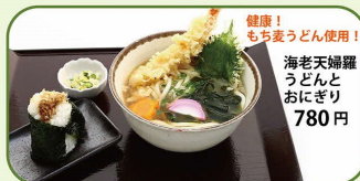
健康! もち麦うどん使用! 海老天婦羅 うどんと おにぎり 780円