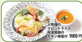
火参畑のラビットライス阿波尾鶏のチキン南蛮付 980円

旬のこだわりメニュー おすすめ 定食 丼 カレー・うどん・お子様 デザートドリンク