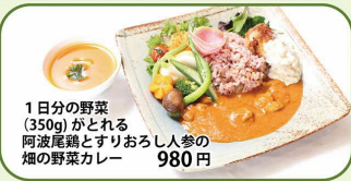
1日分の野菜(350g)がとれる阿波尾鶏とすりおろし人参の畑の野菜カレー 980円