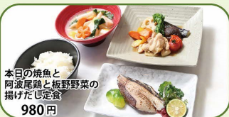
本日の焼魚と阿波尾鶏と板野野菜の揚げたじ定食 980円