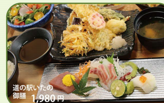
道の駅いわたの御膳 1,980円

旬のこだわりメニュー おすすめ 定食 丼 カレー・うどん・お子様 デザートドリンク