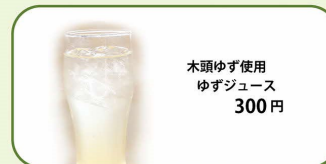
木頭ゆず使用 ゆずジュース 300円