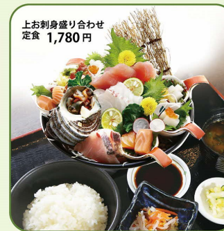
上お刺身盛り合わせ定食 1,780円