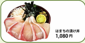
はまちの漬け丼 1,080円