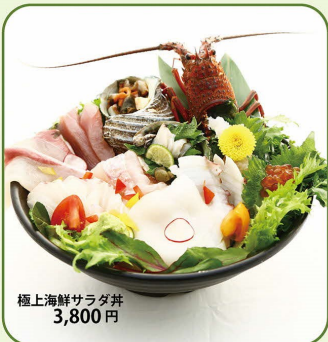
極上海鮮サラダ丼 3,800円