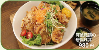
阿波尾鶏の 唐揚げ丼 980円