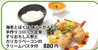
海老とほくほくジャガイモの手作りコロッケ定食 すりおろし人参とカリカリベーコンのクリームパスタ付 880円