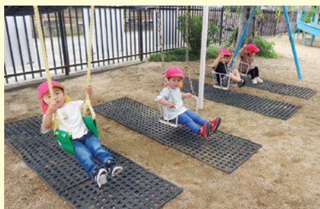
お外でも元気いっぱい遊ぶよ～