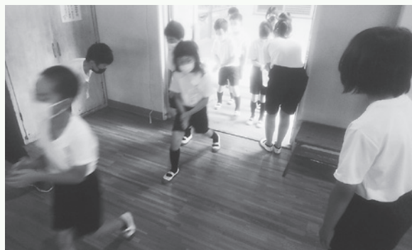
体育館に入る際あいさつ・会釈をしながら6年生が他の学年を迎える。