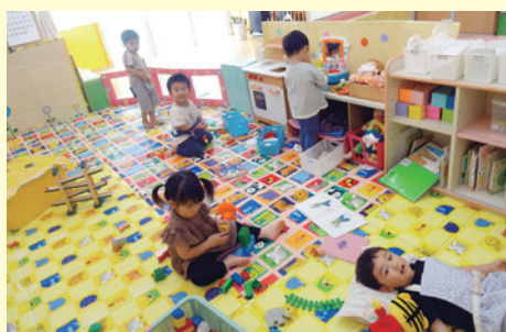
たくさんおもちゃがあって楽しいな♪

板野保育園では一時預かり事業を行っています。対象児は保育園に入園していない1歳半以上の未就学児です。異年齢でおひさま組として過ごしています。毎日でなく久しぶりの登園になっても「先生、来たよ」と笑顔で挨拶してくれ、保育園に来ることを楽しみにしてくれています。 部屋ではままごとやパズルなどで遊び、戸外では築山や遊具に登ったり、虫探しや草花摘みをしたりして遊んでいます。保育園に在籍している同年齢の子たち