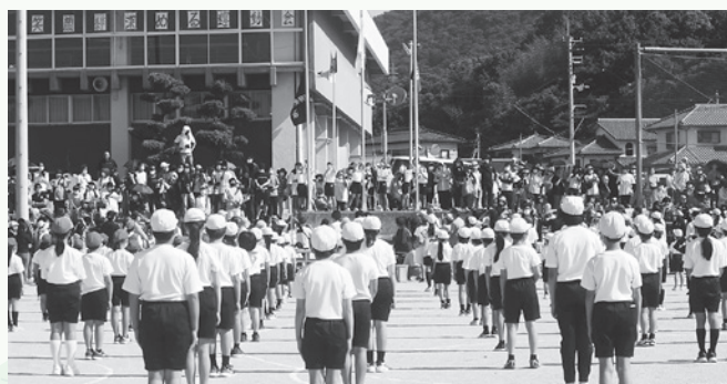
5月29日(日)開催した運動会の様子