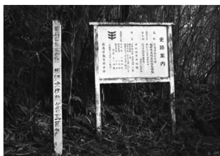
犬伏蔵佐谷の瓦経塚跡

― 讃岐山脈山麓に位置し、東西に通る主要地方道鳴門地田線沿いに集落が立地する。地名については背後にある高い象山が、犬の伏せた形に似ていることにちなむという