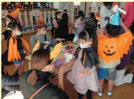
ワクワク ドキドキ 変身だ!

10月の爽やかな秋晴れの中、ハッピーハロウィンデーを開催しました。帽子やマント、ボディペイントなどで魔女やゾンビなど、なりたいたいハロウィンのキャラクターに変装した後は、的当てやスーパースーツボールすくい、宝探しをお家の人と一緒に楽しみました。 子どもたちは、ハッピーハロウィンデーを心待ちにして、各コーナーの準備を友達と一緒に進めてきました。自分たちが作ったガーランドやおぼけかぼちゃ、リースなどで幼稚園の様子が日々、変化していることに心躍らせ、皆が同じ目