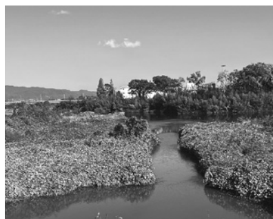
黒谷川河口から旧吉野川を望む

地元の講師による地元の話だけに、説得力があった。黒谷川は阿讃山脈を源流として、板野町の西部を流れている川のひとつだ。『板野町史』はその川の地形を、次のように記録をしている。