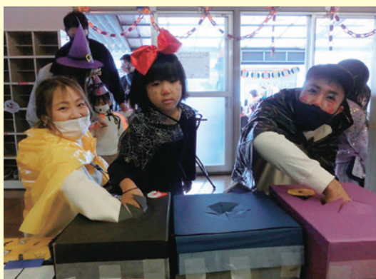
宝は何か出るかな?楽しみ~

10月の爽やかな秋晴れの中、ハッピーハロウィンデーを開催しました。帽子やマント、ボディペイントなどで魔女やゾンビなど、なりたいたいハロウィンのキャラクターに変装した後は、的当てやスーパースーツボールすくい、宝探しをお家の人と一緒に楽しみました。 子どもたちは、ハッピーハロウィンデーを心待ちにして、各コーナーの準備を友達と一緒に進めてきました。自分たちが作ったガーランドやおぼけかぼちゃ、リースなどで幼稚園の様子が日々、変化していることに心躍らせ、皆が同じ目