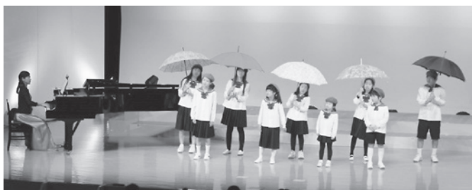
▲いたの少年少女合唱団

2月16日(日)文化の館さくらホールで、「第10回いたの童謡とわらべ歌のつどい」が開催されました。町内から6団体、県内から6団体、全12団体が出演しました。出演者の皆様は、日頃の練習の成果を存分に発揮し、素敵な歌声や演奏などを披露しました。「みんなで合唱」と題したプログラムでは舞台と客席が一体となり「うれしいひな祭り」「春が来た」の歌をみんなで合唱しました。ゲストに徳島少年少女合唱団を迎え大盛況のうちに幕を閉じました。