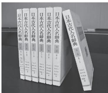
『日本古代人名辞典』（吉川弘文館）