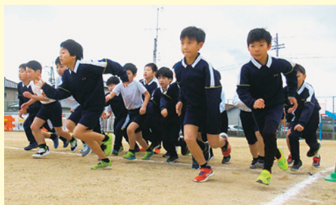
スタートラインから一斉に飛び出します。