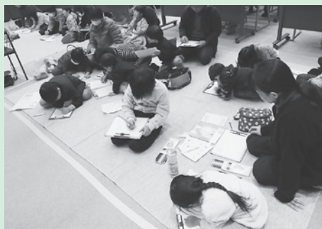
お絵かきタイム (子どもも大人も真剣に絵を描いていました)

絵本ライブの企画・運営など、板野町読書ボランティアクラブの皆様にご協力をいただき開催することができました。