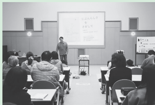
絵本ライブのようす