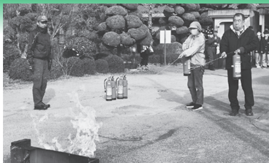
消火器の使い方講習