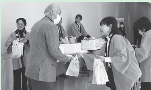
地元食材PRのため町女性農業委員が映画にも登場した「キャロットケーキ」を配布しました。