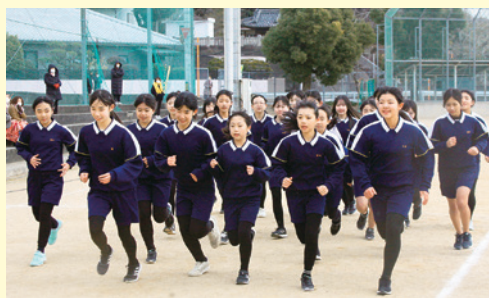
最後の記録会となった6年生も力走しました。

「みんな本当によくがんばった。すごい。」と記録会を終えた後、心の中に喜びがあふれてきました。 1月29日(水)に持久走記録会が行われました。当日は、寒さが厳しく雪がちらつく天候で、最初に出場する1年生の子供たちは身をかめながら運動場にやってきました。しかし、子供たちの表情を見ていると、「がんばってやるぞ。」という気持ちがみなぎっていました。