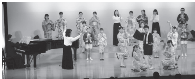
▲徳島少年少女合唱団