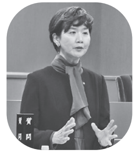
楠本 千草 議員